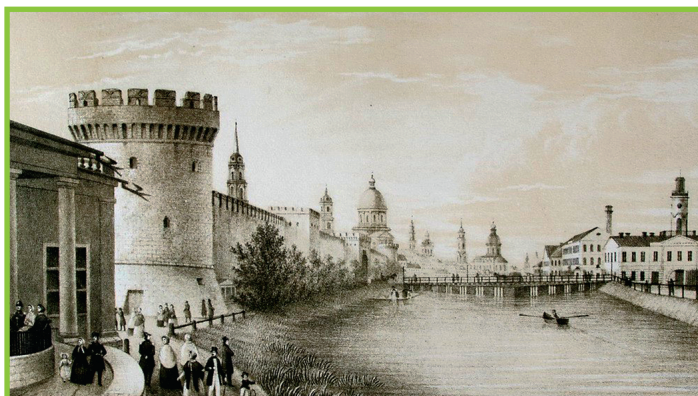
Вид на кремль с северной стороны и «кривого моста».

кла необходимость увеличить территорию для складирования дров и сырья. Во второй раз – в годы Великой Отечественной войны: по решению Государственного комитета обороны ее закрепили за оружейным заводом на военный период. Мало кто знает, что по Казанской набережной проходил «ширококолейный подъездной путь» для подвоза угля на электростанцию, после Великой Отечественной войны он был демонтирован.