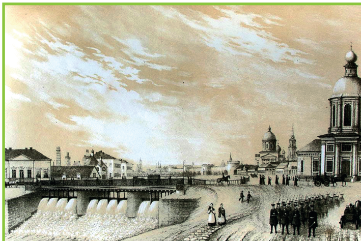
Вид на чугунный мост.

Исторический центр Тулы вместе с ансамблем кремля примыкает к старому руслу реки Упы. На протяжении многих десятилетий это место было известно как Казанская набережная, названная так по храму Казанской Божьей Матери, находившемуся у западной стены кремля, близ Наугольной башни.