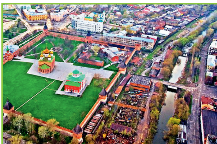
Вид сверху на территорию кремля и берег реки Упы. Фото 2012 года.