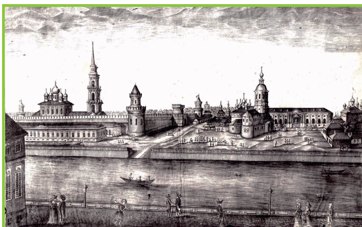
Вид на кремль от оружейного завода.

Власти города дважды предоставляли набережную заводу. Впервые – в 1914 году, когда началась Первая мировая война и возни-